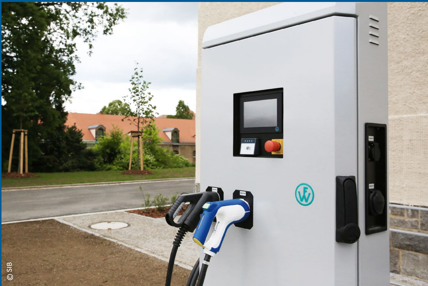
Ladesäule für das Landesamt für Straßenbau und Verkehr in Bautzen